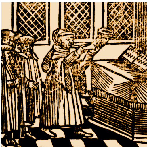
Sefer minhagim, Amsterdam 1723