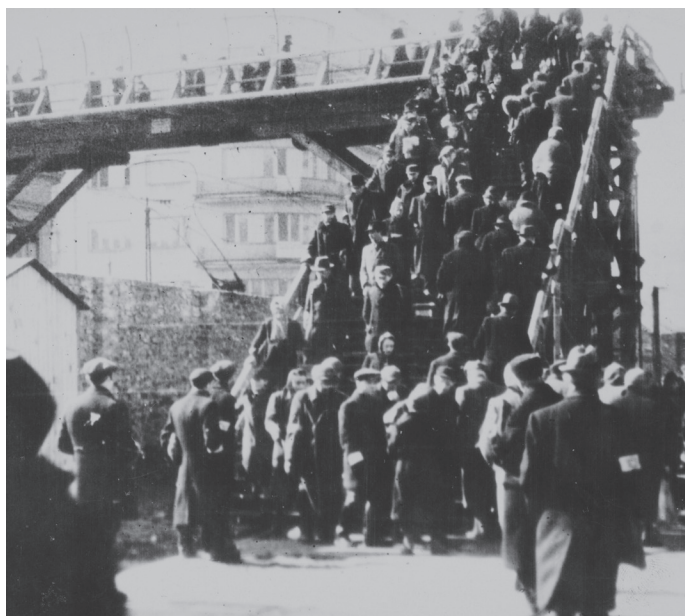
Most na Chłodnej

W czasie powstania w getcie grupa bojowników ŻOB wraz ze swoim komendantem Mordechajem Anielewiczem ukryła się w obszernym bunkrze przy ul. Miłej 18, zbudowanym przez członków żydowskiego