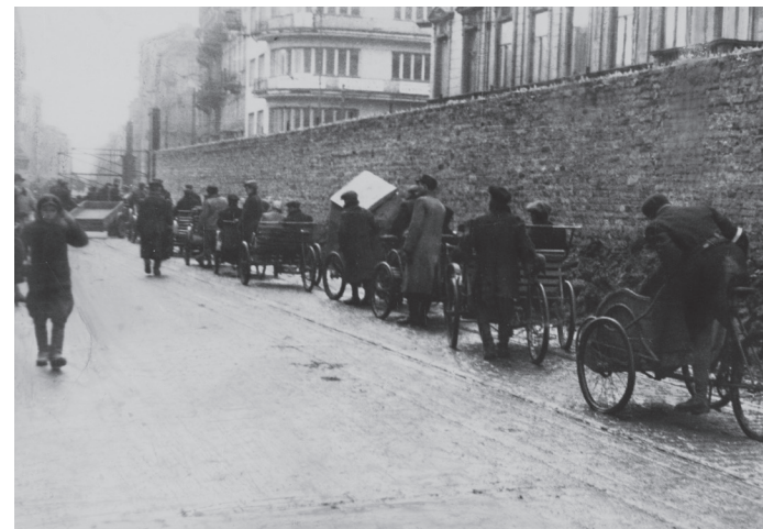
Sznur pojazdów (ryksz) na Żelaznej

Getto Warszawy zostało zamknięte 16 listopada 1940 r., stając się największym gettem w okupowanej Europie. Getto warszawskie, oddzielone od reszty miasta trzymetrowym murem, dzieliło się na dwie części: północne tzw. duże oraz południowe, nazywane małym gettem. Granice getta nieustannie podlegały licznym zmianom, co wiązało się z częstymi przeprowadzkami, a tym samym uciążliwym szukaniem nowego lokum w coraz to bardziej przeludnionej dzielnicy zamkniętej. Do getta trafiali przesiedleńcy również spoza Warszawy.