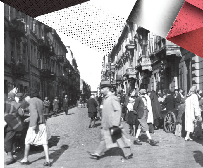
Ul. Miła, widok w kierunku wschodnim

O sierocińcu przy ul. Ogrodowej 29 Adam Czerniaków pisał w swoich dziennikach Byłem na otwarciu sierocińca na Ogrodowej 29. W mowie podkreśliłem, że będę kontynuował ostrą działalność w stosunku do opornych bogaczy, którzy nie chcą nic łożyć na zwalczanie nędzy. W sierocińcu 50 dzieci z ulicy. Między nimi talenty.