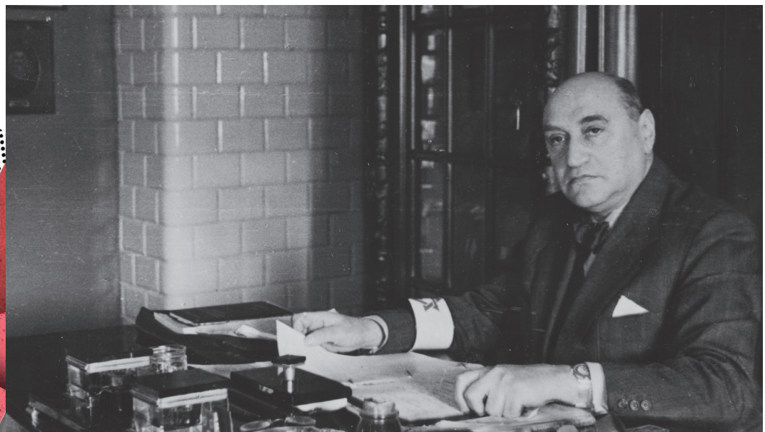
Prezes Rady Żydowskiej Adam Czerniaków

Od grudnia 1941 r. w mieszkaniu na pierwszym piętrze Kamienicy pod Zegarem mieszkał Adam Czerniaków. Był inżynierem, działaczem społecznym i oświatowym, publicystą, radnym miejskim Warszawy, senatorem. 23 lipca 1942 r., w swoim gabinecie przy ul. Grzybowskiej, popełnił samobójstwo.